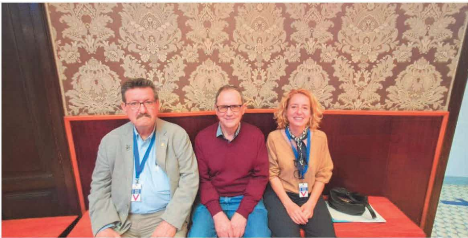
Los vecinos exigen el soterramiento sur de las vías de Serrería

Compartir en Facebook Compartir en Twitter Compartir por mail